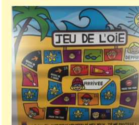
Bâche jeu de l'oie 2m x 2m*