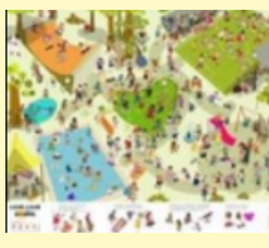
Bâche soleil loisirs*

Pour plus d'informations, vous pouvez prendre rendez-vous en ligne. Nous vous recevrons dans notre espace Ressource pour vous présenter l'ensemble de nos outils.