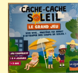
Grand jeu cache- cache soleil*