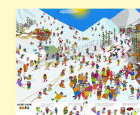
Bâche soleil montagne*