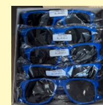
Lunettes de soleil 6-10 ans*