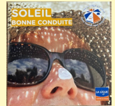
Flyer soleil, bonne conduite