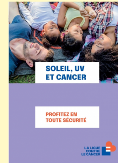
Dépliant soleil, UV et cancer