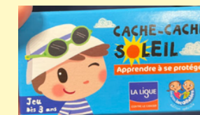
Jeu mémoire cache- cache soleil*