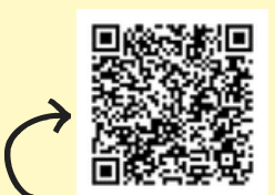
Pour prendre rendez- vous en ligne

Pour plus d'informations, vous pouvez prendre rendez-vous en ligne. Nous vous recevrons dans notre espace Ressource pour vous présenter l'ensemble de nos outils.