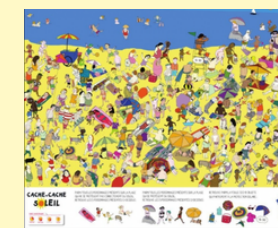
Bâche soleil plage*