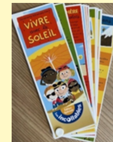
Jeu les incollables