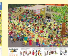
Bâche soleil école*