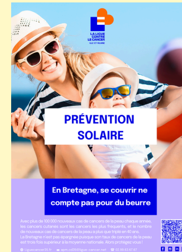
Affiches prévention solaire